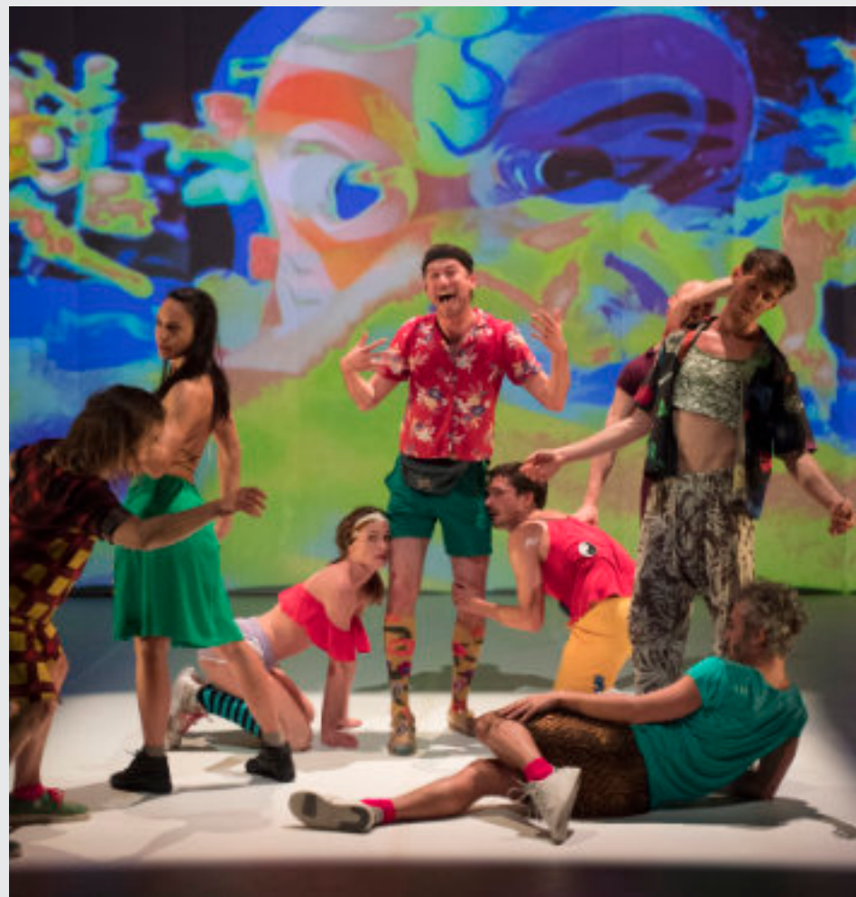
La cinquième saison