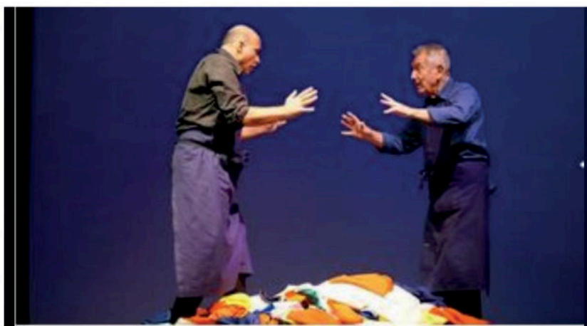
© DR - Klap Marseille Vagabondages & Conversations